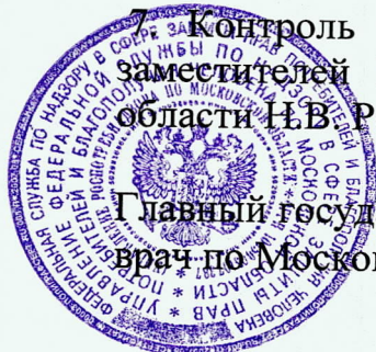
О. Л. Гавриленко

Главный государственный санитарный врач по Московской области